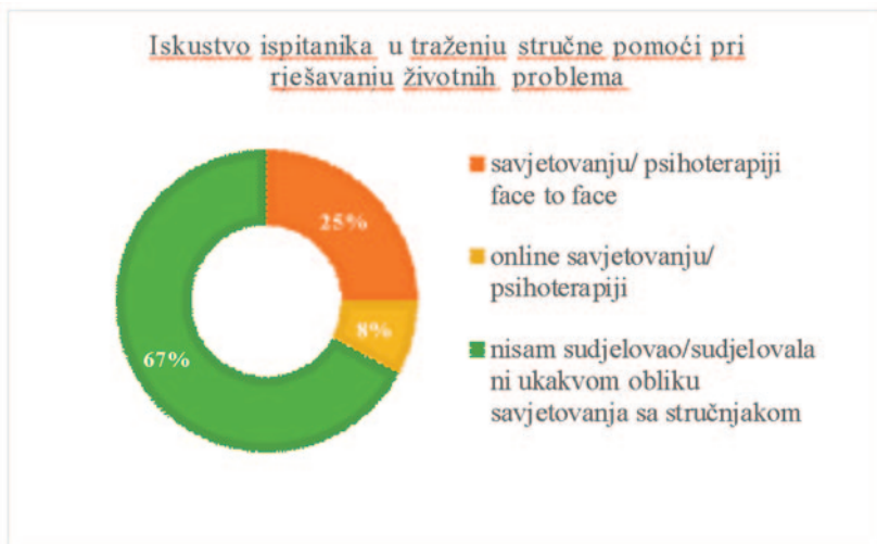
Grafikon 1: Iskustvo ispitanika u traženju stručne pomoći pri rješavanju životnih problema

Istraživanja (Leibert i sar. 2006) su uočila pozitivnu korelaciju između općeg korištenja interneta i korištenja online savjetovanja, te došla do zaključka da pojedinci koji iz ličnih razloga koriste internet više od 10 sati sedmično su ujedno bili i spremniji i otvoreniji koristiti online savjetovanje kao podršku pri prevazilaženju životnih problema. Tako istraživanje koje je provedeno u Austriji 2010. godine na uzorku N= 218 građana pokazalo je obećavajući javni interes za online savjetovanje – 22,9% ispitanika su izjavili da u budućnosti žele koristiti online savjetovanje pri prevazilaženju životnih problema dok 77,1% ispitanika žele koristiti tradicionalni oblik savjetovanja (Klein i Cook 2010). Ipak, podaci za Bosnu i Hercegovinu govore suprotno. Naime, podaci Agencije za statistiku BIH (2022) govore da u Bosni i Hercegovini 75,9% domaćinstava ima pristup internetu i da više od 1.400.000 osoba koristi internet više puta u toku dana. Iako su građani svakodnevno konektovani, gotovo nikako ne koriste mogućnosti savjetovanja sa stručnjacima, što potvrđuju rezultati i našeg istraživanja. Naime, prema podacima Agencije za statistiku BIH (2022) građani najčešće koriste internet za telefoniranje i uspostavljanje video poziva (96,1%), slanje i primanje elektronske pošte (92,5%), slanje online poruka (92,3%), usluge internet bankarstva (41,4%).