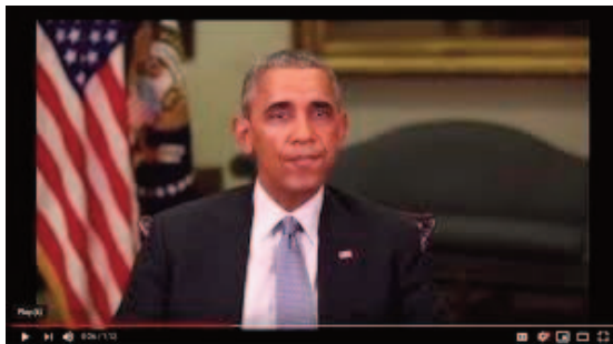
Slika 2. Uvjerljivi deepfake Baraka Obame iz 2018. godine