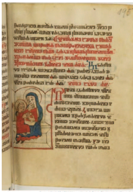
Bogorodica s djetetom