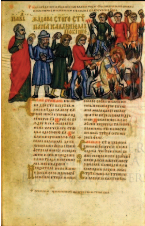
Kamenovanje sv. Stjepana

Rekli smo da je pisan kaligrafskom ustavnom ćirilicom. Njegove minijature i iluminacije 12 predstavljaju sintezu različitih stilskih izraza, odnosno, riječ je o ukrasima visoke kvalitete koji predstavljaju simbiozu bizantskoga i gotskoga stila (Jurić- Kappel 2013: 29). Na njemu su radila dva majstora. Prvi iluminator pripada kasnogotičkoj bolonjskoj iluminatorskoj školi. On je radio portrete apostola uglavnom na plavoj pozadini. Drugi je, po svemu sudeći, bio sam Hval. Da je to tako, upućuju nas dva zapisa na marginama na folijama 48r i 188 r (na obje stranice piše: pisah zlatom kako i črnilom ). Hval je pravi minijaturist, koji je bio pod utjecajem talijanskog slikarstva, i mada kod njega ima nešto bizantske tradicije, očigledan je specifičan utjecaj zapadne minijature koja se pod talijanskim utjecajem razvila na dalmatinskoj obali, u Zadru i Splitu ( Zbornik Hvala krstjanina 1986: 24). Treba istaknuti da je iluminacija rađena tako vješto i stručno da su boje sačuvane potpuno svježije i žive do naših dana.