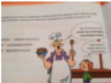
Слика 4 Семантичка истоветност конгруентног и неконгруентног атрибута

Још једна илустрација допринеће бољем разумевању ове наставне јединице. На врло занимљив начин приказана је семантичка истоветност конгруентног и неконгруентног атрибута и на тај начин је указано да службу атрибута могу имати и именице у неком зависном падежу, чоколадни колач и колач од чоколаде . И овде је илустрација издвојена као функционална употреба сликовних средстава изражавања ( Д 2 стандард ).