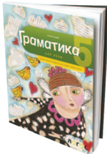
Слика 2 Уџбеник за пети разред основне школе издавачке куће Логос