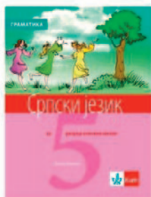
Слика 1 Уџбеник за пети разред основне школе издавачке куће Клет

У наредном делу рада управо ће бити анализирани уџбеници за пети разред основне школе издавачких кућа Клет и Логос . Приликом анализе посебну пажњу посветићемо проналажењу Д стандарда , у коликој мери су заступљени у овим уџбеницима, који од стандарда није присутан и колико његово одсуство утиче на садржај и квалитет одређеног уџбеника.